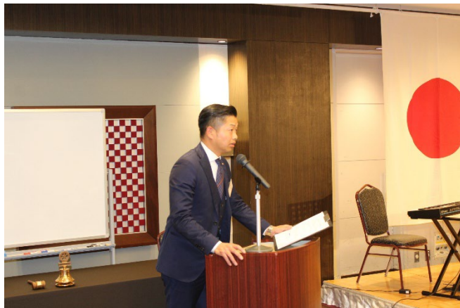
クラブ管理運営委員会担当「忘年夜間例会」